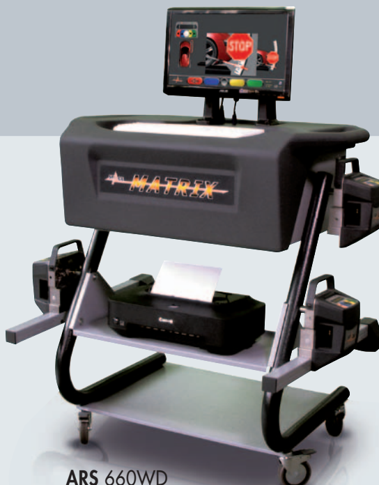
ARS 660WD 6CCD