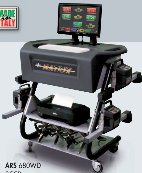
ARS 680WD 8CCD